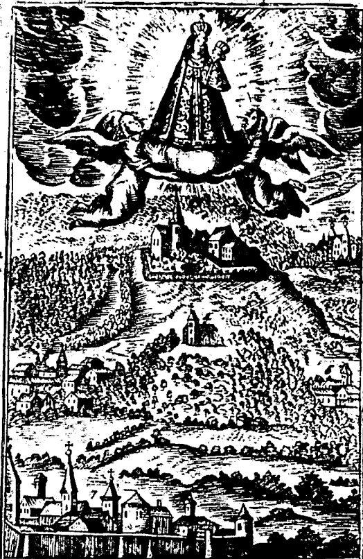
N. 1. Ansehnliche Gegend des heiligen Orts Schauenberg 1. die Wallfahrts-Kirchen, 2. die Wohnung der PP. Einn. ciscaner, 3. das Gottshaus Mahrbach, 4. Kirchlein St. Leonardi, 5. der Mariä Geyerschwey, 6. der Mariä Pfaf- senheim, 7. die Stadt Ruffach.

Neu, Vermehrter Geistlicher Weeg-Weiser, Das ist: Weiß und Manier verdienstlich zu walt- fahrten, sonderlich zu dem Schönen Gnaden-Bild Maria-Sulff, Auf dem Schauanberg; Im obern Elßß bey Ruffach. In zweyen Theilen abgetheilet: Der Erste bestehet in schönen Morgends: Meß: Beicht: Com- munion: und Vesper: Gebettern, 266 Der andere Theil hat neben den Abends: Gebettern, was vor der Ab- reiß, an dem Heil. Ort und auff der Ruff- Reiß zu verrichten, und andere Gebetter mehr, welche hinten in dem Register zu finden. Sechset Druck / mit schönen Bildern gezieret. Cum Jussu Superiorum, Verfertiget durch PP. B. Franciscan. Prov. Arg. und zu einem ordinari Gebett-Buch eingerichtet. Schleisstatt / gedruckt bey F. U. Gasser, Buch- und Kupfer-Drucker, und Buchhändler: 1749.